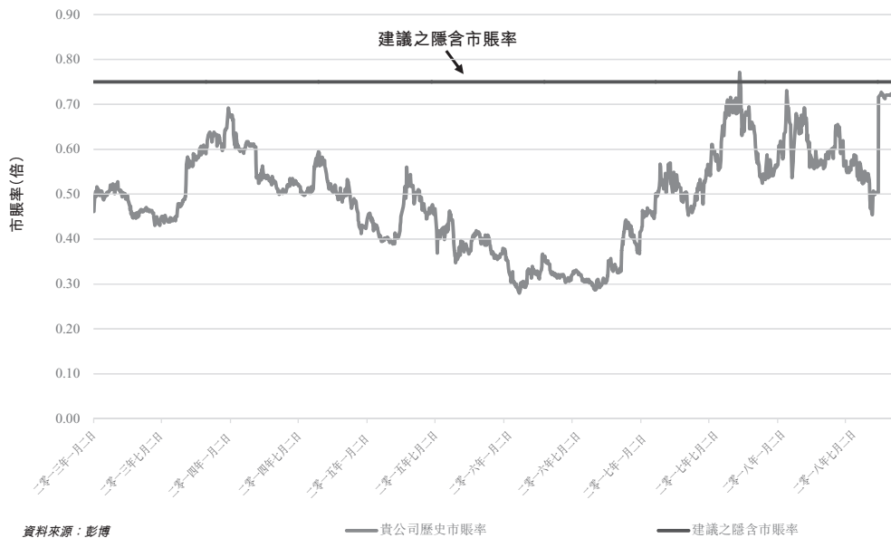
圖2：貴公司歷史市賬率與建議之隱含市賬率之比較

建議之隱含市賬率約為0.75倍，乃根據註銷代價2.70港元、貴公司3,992,100,000股之已發行股本及於二零一八年六月三十日貴公司股東應佔資產淨值約1,836,947,000美元計算。於回顧期間內，貴公司歷史市賬率介乎約0.28倍至約0.77倍。如上文圖2所示，除二零一七年九月二十二日之市賬率約0.77倍外，於回顧期間內之市賬率低於建議之隱含市賬率約0.75倍。近期市賬率上升，主要由於如上文圖1所示於刊發公告後股價上漲所致。